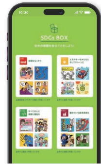
夢ナビマイページ (SDGs BOX)