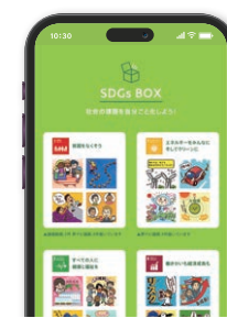
夢ナビマイページ (SDGs BOX)

夢ナビマイページの「SDGs BOX」に、生徒が登録したSDGsに関連する「夢ナビ講義」「夢ナビ講義動画」が届きます(講義動画は収録している担当教授のみ)。 さまざまな分野で活躍する大学教授の研究を通じて、生徒は自分が社会にどう関わりたいのかを多面的に考えることができます。また、自分にできる社会貢献や将来像をイメージするきっかけになります。