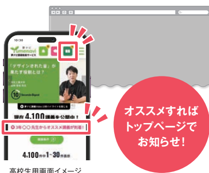
高校生用画面イメージ