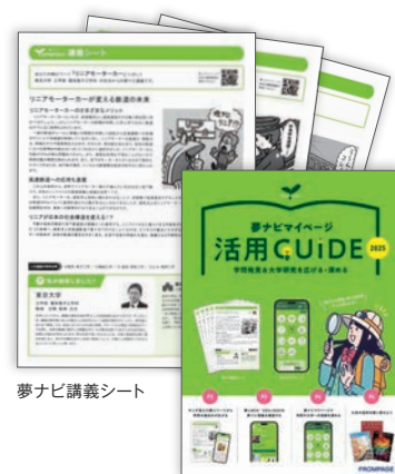
夢ナビ講義シート

※関心ワード・SDGs登録用サイトで登録する「夢ナビのパスワード」と郵便番号で、「夢ナビマイページ」にログインできます。